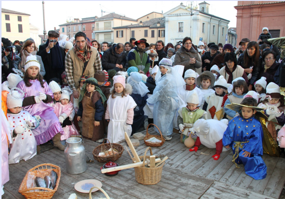
I mestieri all'opera