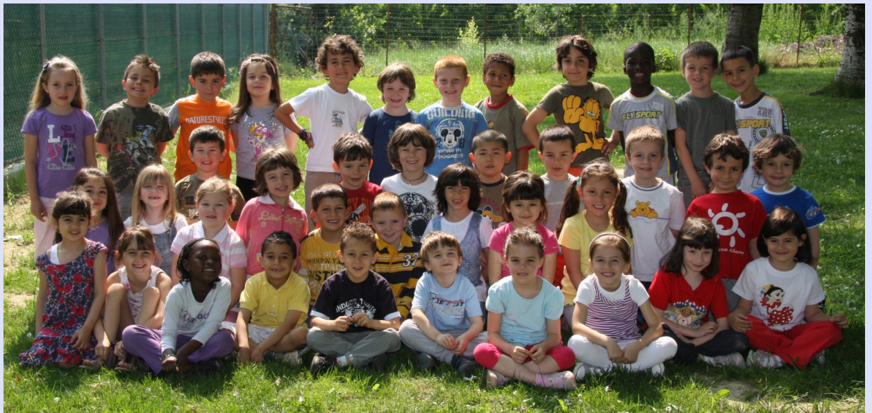
Il saluto delle Api