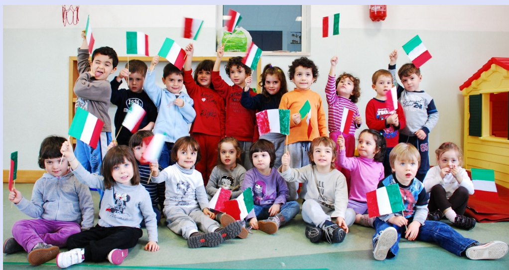
150 anni ... oggi