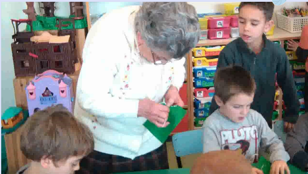
Il laboratorio di Iride