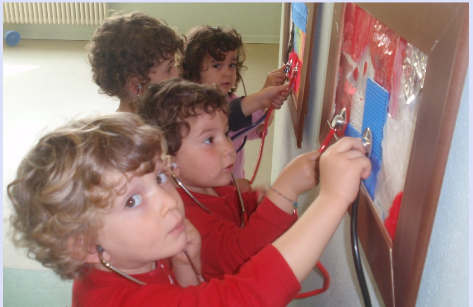
Dottori in "Tecnologia dei materiali ... sonori"

Ci sono stati molti commenti da parte dei piccoli, che erano stupiti dal poter ascoltare e toccare un quadro, quando solitamente viene solo guardato. Alcuni di loro erano talmente entusiasti che hanno voluto far fare l'esperienza anche ai propri genitori, dicendo: "Senti mamma, questo quadro fa scrak scrak!".