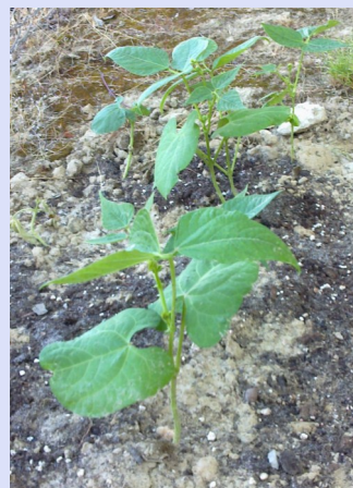
I fagioli magici

Di sicuro, anche a loro rimarrà, non solo nella pancia, un bellissimo ricordo dell'Asilo.