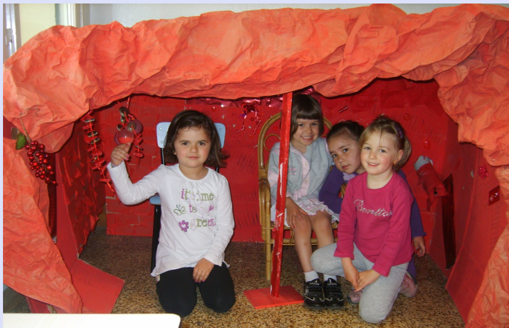
La grotta musicale

“Il tigrotto si nasconde con le orecchie fra le